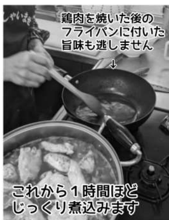
鶏肉を焼いた後の フライパンに付いた 旨味も逃しません