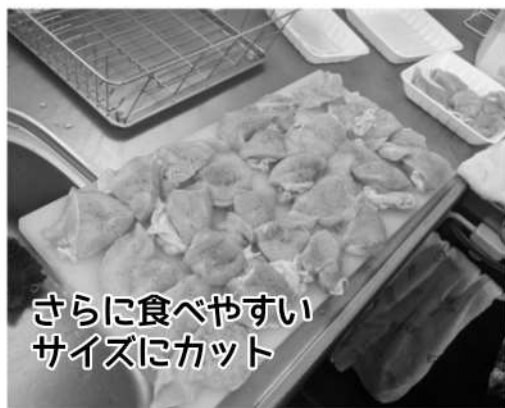
さらに食べやすい サイズにカット