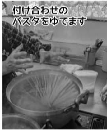
付け合わせの パスタをゆでます