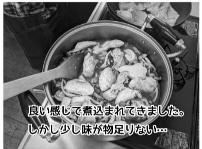
良い感じで煮込まれてきました。 しかし少し味が物足りない...