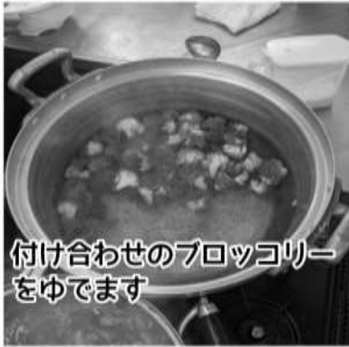
付け合わせのブロッコリーをゆでます