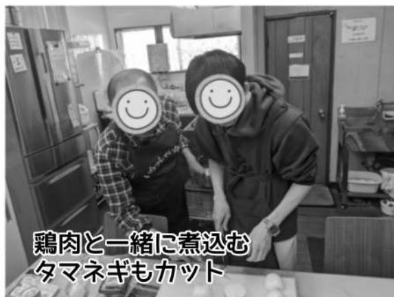
鶏肉と一緒に煮込む タマネギもカット