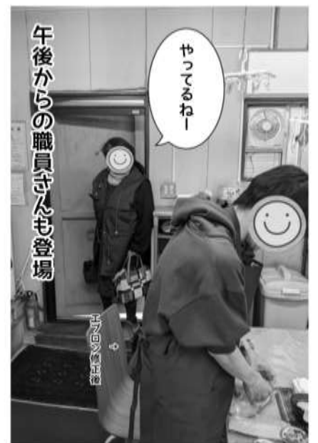
午後からの職員さんも登場