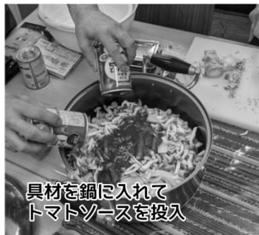
具材を鍋に入れて トマトソースを投入