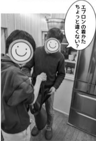
エプロンの着かた ちょっと違うかい?