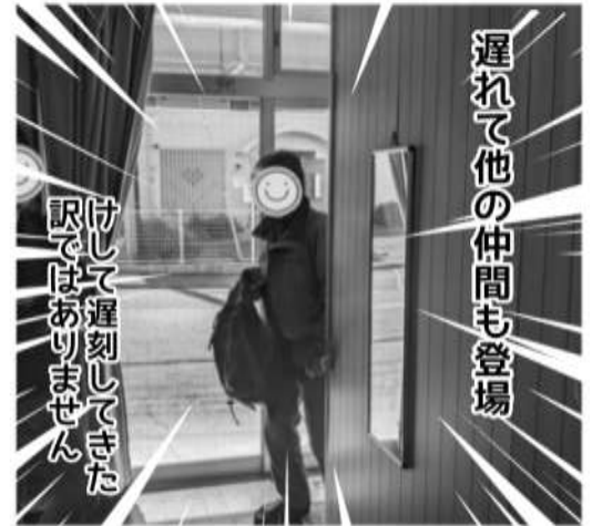
遅れて他の仲間も登場