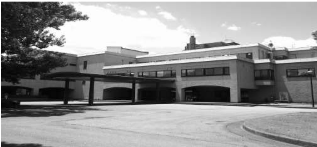
写真：ラウンドアップ会場国立女性会館又エック