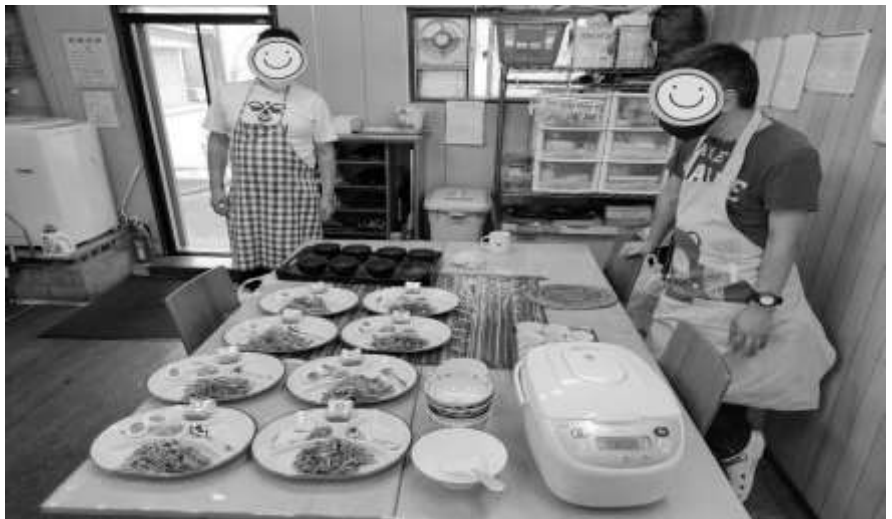
「ワクワクドキドキの調理実習」

今日久々に仲間と料理しましたが、仲間と一緒に料理を作る楽しさを思い出すことができました。また調理実習をしたいです。